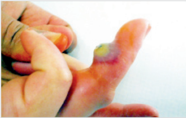
Figure 1. Virus Orf au stade 2.